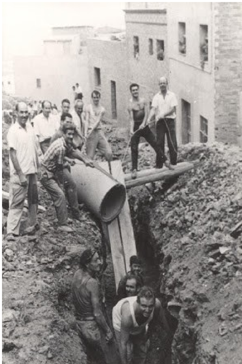
Vecinos de Roquetas trabajando en la construcción del alcantarillado “Urbanizando en domingo”