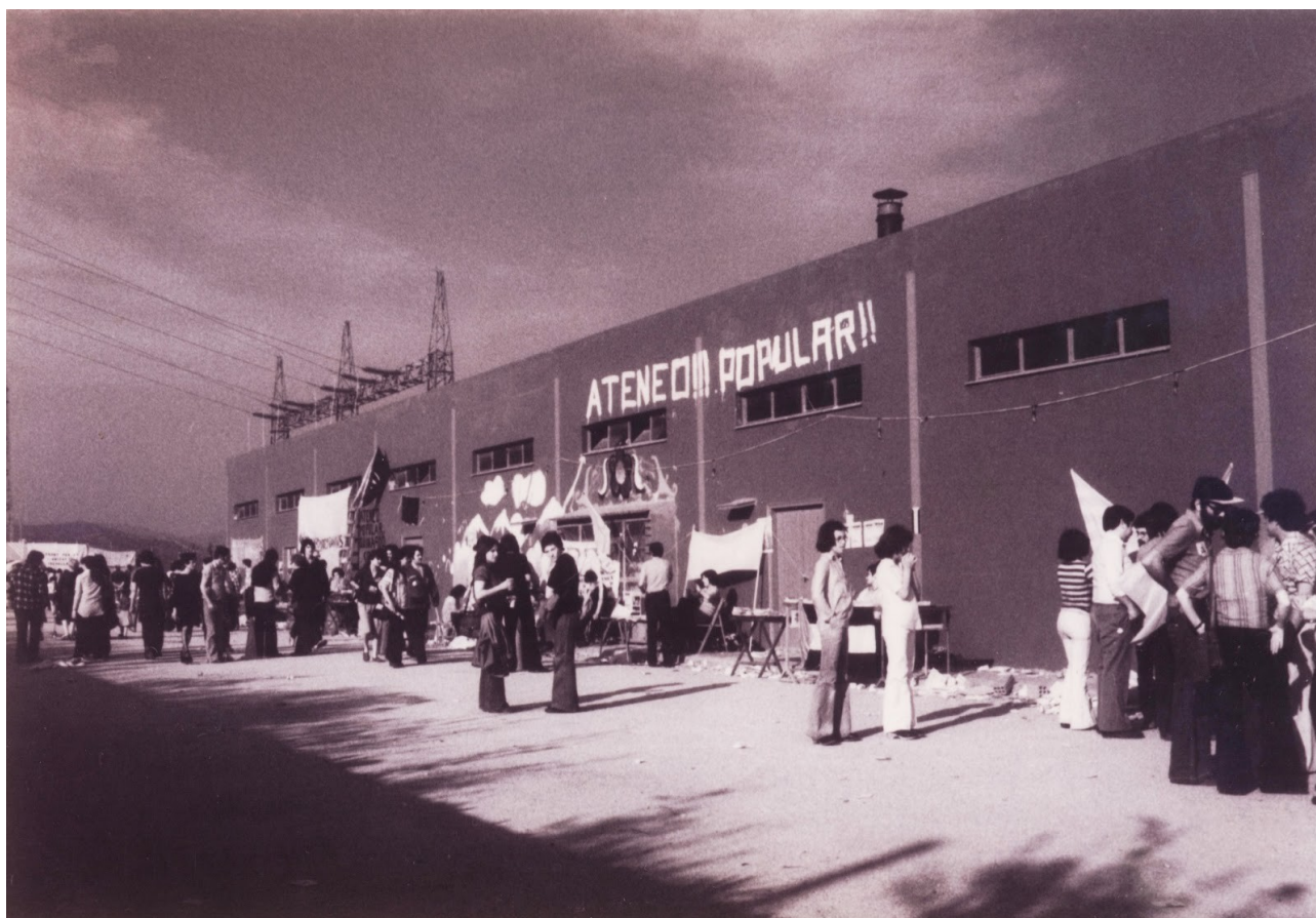
Actividades culturales durante la ocupación de la planta asfáltica, actual Ateneo Popular de 9Barris.